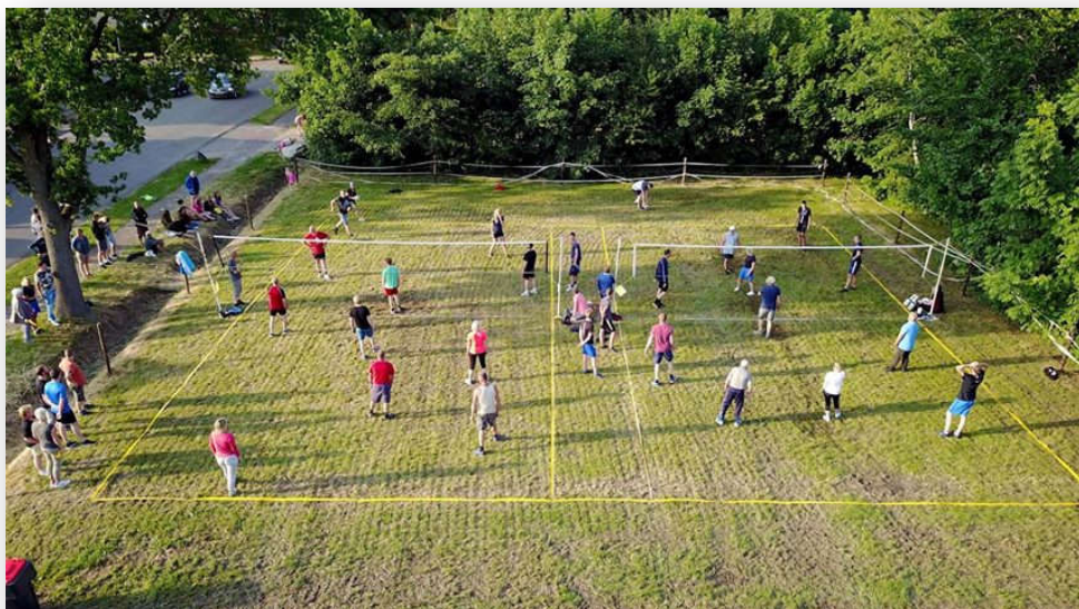
Foto makke troch Gerlof Otter fan it Nijemardumer Volleybaltoernoai